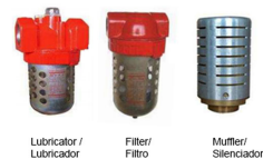
Lubricator / Lubricador