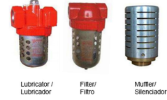
Lubricator / Lubricador