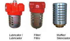
Lubricator / Lubricador