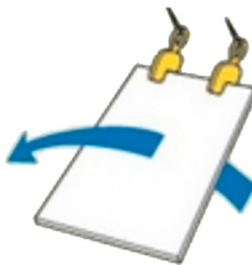
Vertical lifting of steel structures / Izaje vertical de estructuras de acero