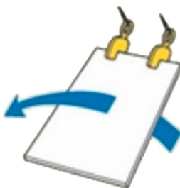
Vertical lifting of steel structures / Izaje vertical de estructuras de acero